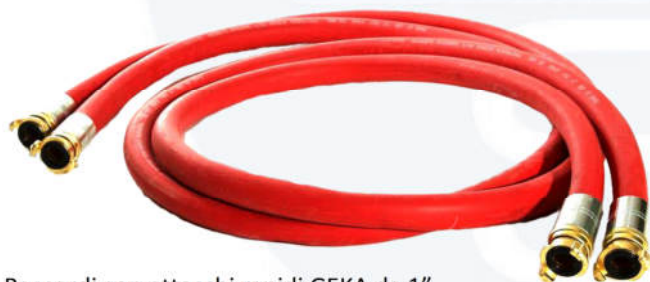
Raccordi con attacchi rapidi GEKA da 1"