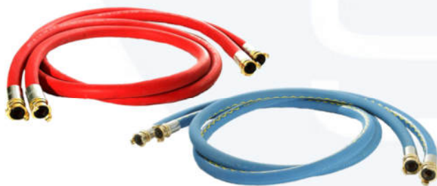
Raccordi con attacchi rapidi GEKA da 1"